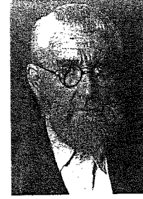
Necmeddin Okyay (üstte).