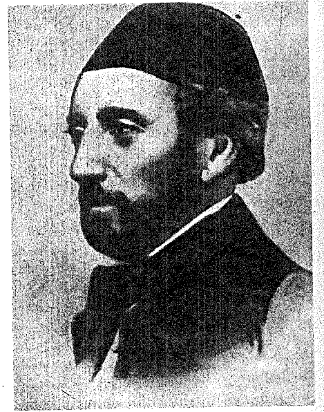
A. Kemal Paşa.

gelişmeler, büyük ilerlemeler görülmüştür.