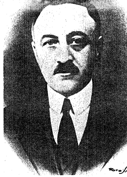
Dr. Rıza Nur.